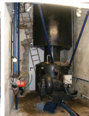
Figures 4 à 5 : chaufferie fonctionnant avec de la biomasse